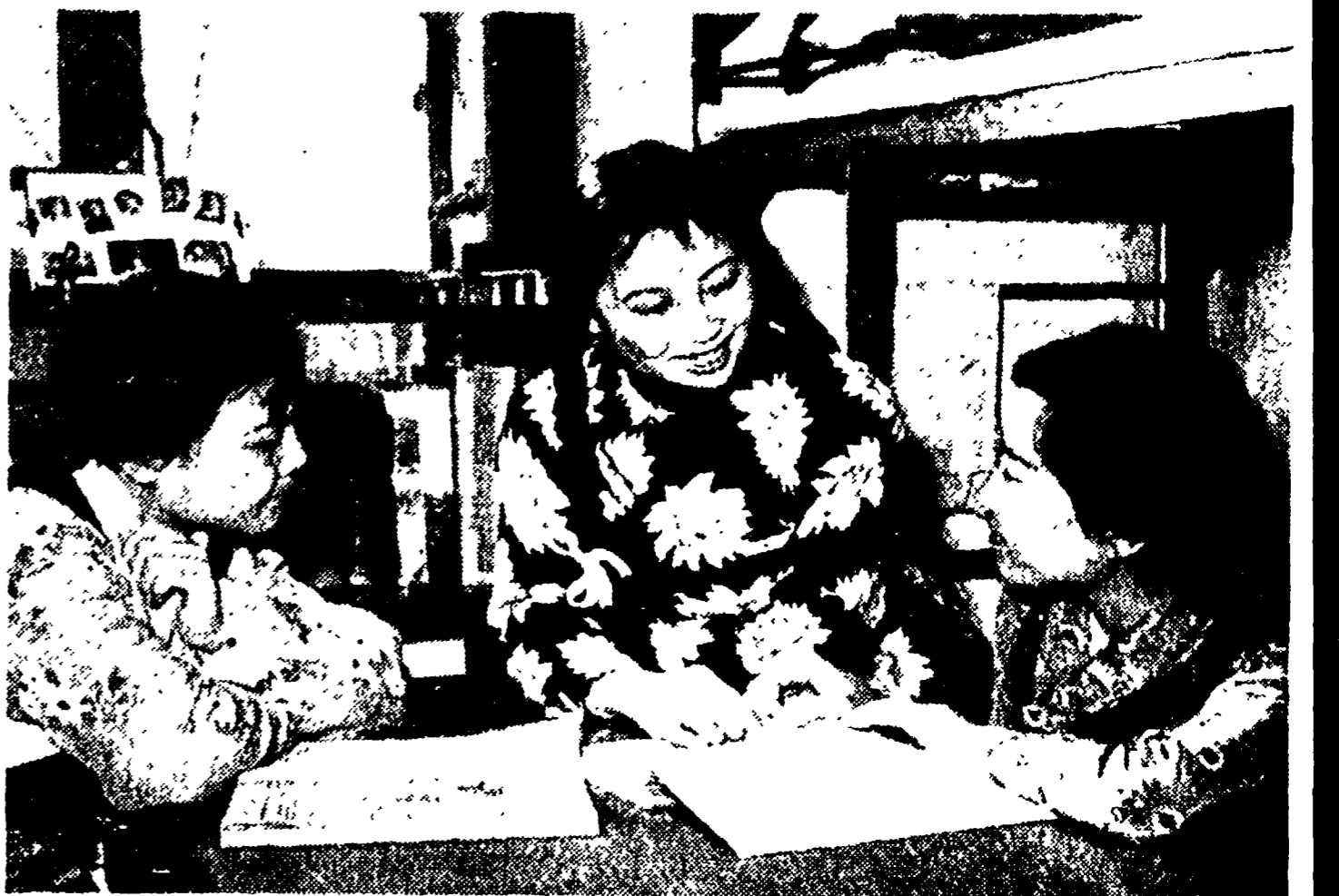
Una studentessa in medicina della regione autonoma del Tibet. La rivoluzione ha dischiuso le porte della cultura alle donne della nuova Cina

Tra le persone che ho conosciuto nel mio viaggio in Cina rimarrà sempre presente alla mia memoria la moglie di un capitalista di Shanghai rimasto nel suo Paese, dopo la rivoluzione, per collaborare alla ricostruzione democratica. Ci ha ricevuto nella sua casa, in un quartiere silenzioso e tranquillo; una casa senza nulla di sfarzoso ma raffinata. La moglie, una figura giovanile, vestita con molto gusto e semplicità, con grazia ci offre dolci e tè e sorride mentre il marito, sotto il fuoco di fila delle nostre domande, qualche volta indiscrete, ci descrive la sua nuova vita di lavoro. Non insiste, il marito, a parlare delle sue ricchezze, di un tempo; dice soltanto di aver occupato un posto molto alto nella gerarchia delle famiglie e nobili di Shanghai e di aver posseduto fabbriche molto importanti, sorvola sui particolari ma noi possiamo egualmente immaginare ogni ora della sua vita passata: denaro, potere, servi, ossequio; e in tutto una grande solitudine non ancora scossa dal rumore delle feste. Il capitalista ha intelligenza e sensibilità, può giudicare e obiettivamente quella sua vita passata. «Ora — dice — sono sereno e contento, soprattutto perché vivo in mezzo a gente serena e contenta e mi sento utile anche; non devo costruire più una miserabile felicità sulla sofferenza altrui, sull'abbruttimento dei servi e delle donne. Ora ho capito anche che cosa significa avere accanto una vera compagna».